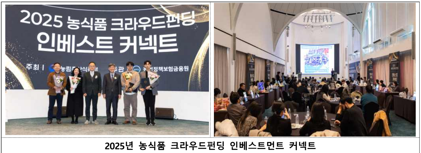
2025년 농식품 크라우드펀딩 인베스트먼트 커넥트