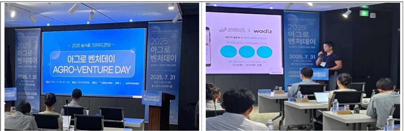
2025년 농식품 아그로벤처데이(IR)