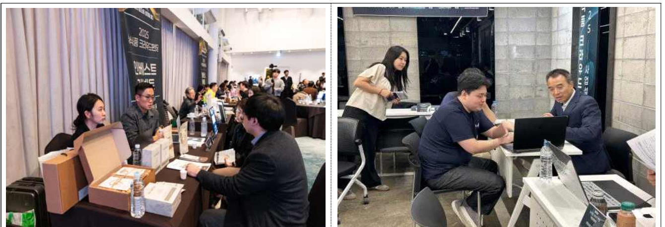
2025년 농식품 클라우드펀딩 맞춤형 IR 컨설팅