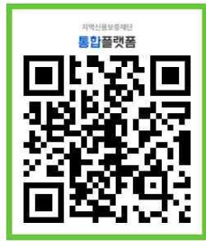
※ 회원가입 QR코드

- 통합플랫폼을 통해 회원가입 후 신청하거나, 원주지점에 전화하여 직접 상담예약 신청 후 방문