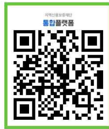
※ 보증신청 QR코드